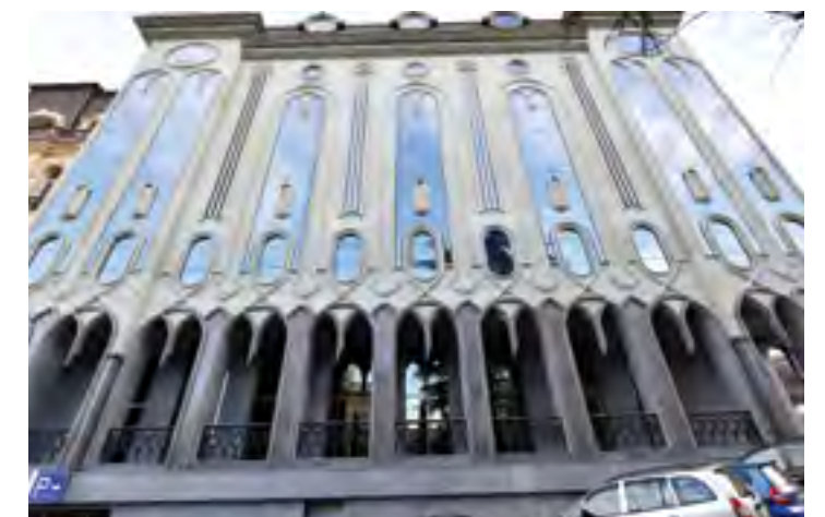
თანამედროვე ხელოვნების მუზეუმი ■ MODERN ART MUSEUM