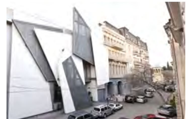
სასტუმრო - GUESTHOUSE ■ არტ ჰაუსი - ART HOUSE