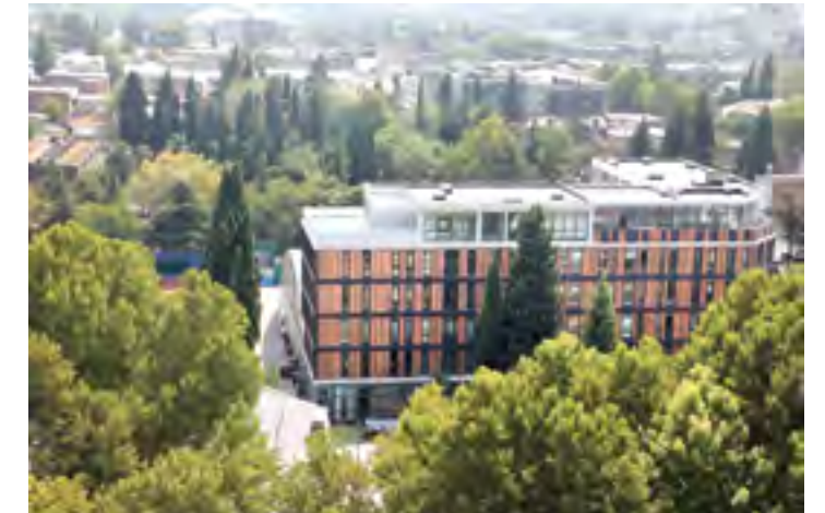
ჩოგბურთის აკადემია ■ TENNIS ACADEMY